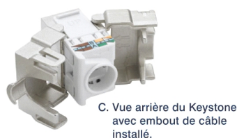
C. Vue arrière du Keystone avec embout de câble installé.