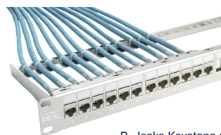
D. Jacks Keystone montés dans un panneau de connexion chrome, n° de pièce 100-028